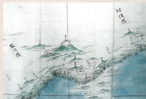
伊能忠敬中図 富士山付近

伊能忠敬（1745～1818）は、江戸時代に初めて実測による日本地図を完成させた測量家です。上総国（現在の千葉県）で生まれた忠敬は、17歳で佐原の伊能家に婿養子に入り、醸造業などを営みながら名主として村のために尽力しました。隠居後は50歳で江戸に出て暦学や天文学を学んだ後に日本の測量を開始。歩いた距離は約3.5万kmにもおよびます。この言葉は忠敬が長男に与えたとされる「家訓書」にあるもので、「どのような人の意見でも役に立つことであれば取り入れなさい」という意味です。